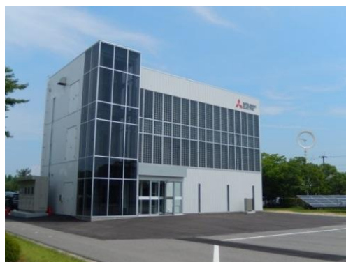
D-SMiree Development and Demonstration Facility

Le développement et les tests de produits, ainsi que l'exposition et la promotion des systèmes de distribution de courant continu, seront gérés par la DC Development and Demonstration Facility, qui a été inaugurée en juillet au Power Distribution Systems Center de Mitsubishi Electric à Marugame, préfecture de Kagawa, au Japon. Les ventes de D-SMiree pour systèmes de distribution de CC MT/BT devraient atteindre 10 milliards de yens, soit environ 94,1 millions de dollars US, d'ici 2025.