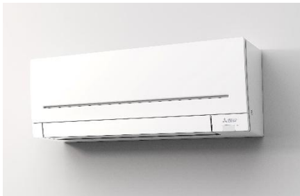
Le climatiseur individuel série MSZ-AP