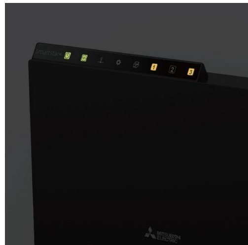
Rendu 4 : affichage de pictogrammes rétroéclairés