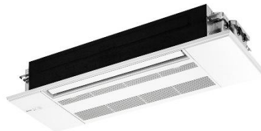
Le climatiseur unidirectionnel de type cassette pour plafond série MLZ-KP/MLZ-RX/MLZ-GX/MLZ-HX