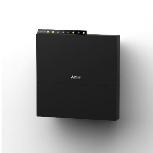
Rendu 1 : installation murale

* Indice IP de résistance à l'eau et à la poussière définis par la Commission électrotechnique internationale (CEI). Le premier chiffre est l'indice de résistance à la poussière et le deuxième chiffre est l'indice de résistance de l'eau