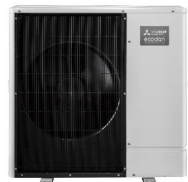
La pompe à chaleur air-eau pour unité extérieure Ecodan série PUHZ-AA