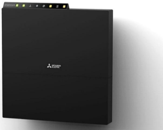
Passerelle de communication XS-5R/XS-5T Mitsubishi passerelle de communication IoT résistante à l'environnement

La passerelle de communication XS-5R/XS-5T Mitsubishi est une passerelle de surveillance à distance, de prévision de pannes, de gestion intégrée de plusieurs sites et d'autres solutions IoT. En plus de ses applications dans les usines et les bâtiments, elle est utilisée pour assurer la sécurité des infrastructures ainsi que pour ses fonctions de sécurité comme la surveillance à distance des niveaux de la mer et des rivières et la prévision de panne des équipements et des installations de génération d'énergie éolienne et solaire.