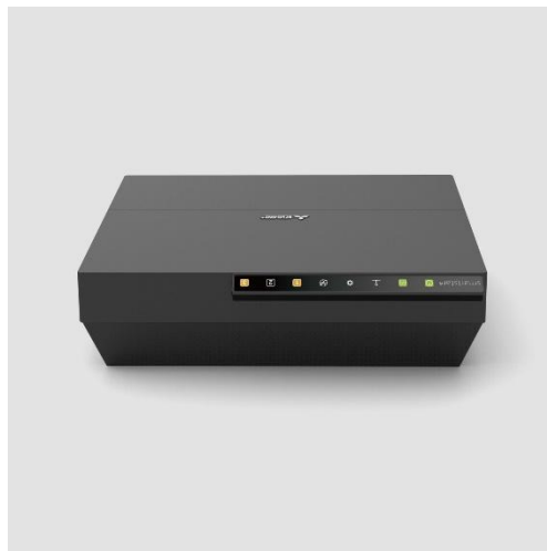
Rendu 3 : installation sur un support horizontal