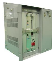
Système de gestion des trains

Connaissant le savoir-faire et l'expérience de Mitsubishi Electric à Hong Kong depuis les années 1980, CRRC Qingdao Sifang a choisi Mitsubishi Electric pour le contrat de fourniture d'une solution intégrée comprenant des systèmes de propulsion, des systèmes d'alimentation auxiliaire et des systèmes de gestion des trains pour les 93 rames. CRRC Qingdao Sifang devrait réceptionner la commande entre 2016 et 2022.