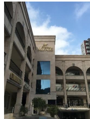
Le Mexico Monterrey FA Center, implanté dans le bureau de Monterrey de Mitsubishi Electric Automation, Inc.

Les investissements dans la production industrielle sont en hausse au Mexique, notamment dans les secteurs des équipements électriques et électroniques. Cette tendance devrait contribuer à soutenir la demande en matière d'automatismes industriels, ainsi que celle d'un vaste éventail de services connexes.