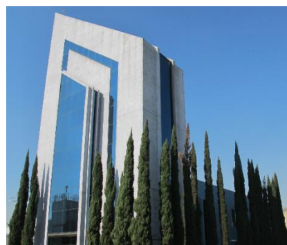
Le Mexico City FA Center, implanté dans la filiale au Mexique de Mitsubishi Electric Automation, Inc.