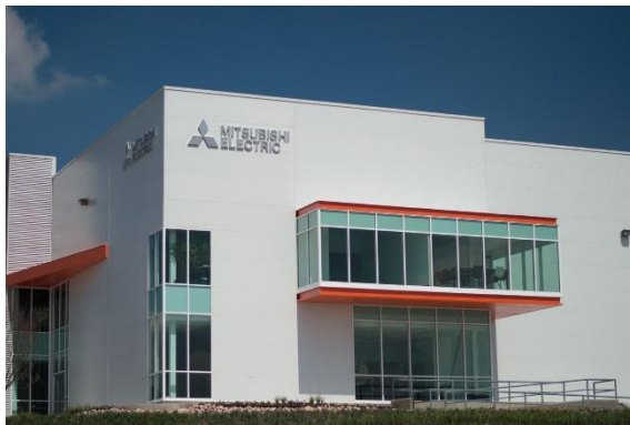
Le Mexico FA Center, implanté dans le bureau de Querétaro de Mitsubishi Electric Automation, Inc.

TOKYO, 12 mai 2017 – Mitsubishi Electric Corporation (TOKYO : 6503) a annoncé aujourd'hui que ses opérations au Mexique ont établi deux nouvelles installations d'entretien d'automatismes industriels (Factory Automation : FA) : le Mexico FA Center à Querétaro et le Mexico Monterrey FA Center dans le Nuevo León. Cette extension du réseau permettra à Mitsubishi Electric de renforcer et d'accélérer le service client ainsi que l'entretien des produits FA au Mexique. Les deux centres ont ouvert leurs portes le 15 mai.