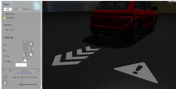
Outils servant au développement et à l'évaluation d'un nouveau système d'indicateurs

Les illuminations projetées sur la route avertissent efficacement les autres usagers des déplacements et des actions du véhicule, même par mauvais temps. Les animations du système d'illumination changent lorsque des capteurs, placés à divers endroits du véhicule, détectent des perturbations autour de celui-ci, notamment l'approche d'un piéton. Le système utilise également des illuminations intérieures pour informer le conducteur sur les alentours du véhicule.