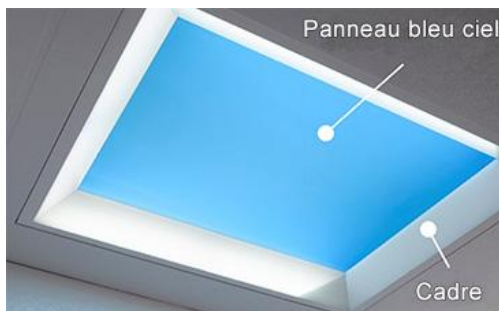
Prototype imitant le ciel bleu

TOKYO, 27 septembre 2018 – Mitsubishi Electric Corporation (TOKYO : 6503) a annoncé aujourd'hui avoir développé une technologie d'éclairage intérieur qui imite les variations quotidiennes de la lumière naturelle, du lever du soleil au ciel bleu, jusqu'au crépuscule. Le système, doté d'un panneau fin et d'un cadre mesurant moins de 100 mm, utilise une méthode d'éclairage périphérique brevetée qui émet de la lumière LED provenant des bords du panneau lumineux. Il est ainsi possible d'obtenir un éclairage naturel avec une profondeur et une couleur similaires à celles du ciel. Mitsubishi Electric présentera sa nouvelle technologie lors du CEATEC JAPAN 2018, au centre d'expositions Makuhari Messe à Chiba (Japon) du 16 au 19 octobre. La date du lancement commercial sera annoncée ultérieurement.