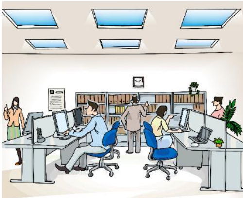
Exemple d'application en tant que puits de lumière