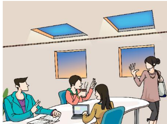
Exemple d'application en tant que puits de lumière et fenêtres

Les espaces de travail sont en cours de modernisation afin de créer des environnements confortables qui stimulent et motivent les employés. Cette évolution passe notamment par l'amélioration de l'éclairage dans les bureaux sans fenêtres ou qui disposent uniquement de fenêtres sombres ou couvertes. Contrairement aux systèmes d'éclairage LED classiques, le nouveau système de Mitsubishi Electric reproduit la lumière naturelle avec des couleurs comparables à celles d'un lever de soleil, d'un crépuscule ou d'un ciel bleu. Grâce à une impression de profondeur optimale, les espaces intérieurs paraissent plus grands et plus ouverts.