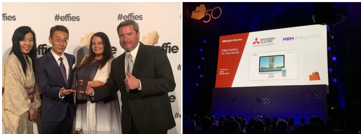
La cérémonie de remise des prix Effie Awards (heure locale le 30 mai 2019 : à New York, GALA Effie USA)

TOKYO, le 3 juin 2019 – Mitsubishi Electric Corporation (TOKYO : 6503) a annoncé aujourd'hui que le site Web Building Solutions de Mitsubishi Electric US, Inc. a reçu le prix de bronze dans la catégorie inter-entreprises « business-to-business » (BtoB) des Effie Awards, un programme international de récompenses reconnaissant l'excellence dans le domaine de la publicité. Mitsubishi Electric est le seul gagnant de la catégorie BtoB cette année ; c'est la première fois qu'un fabricant japonais de matériel électronique remporte un Effie Award dans cette catégorie.