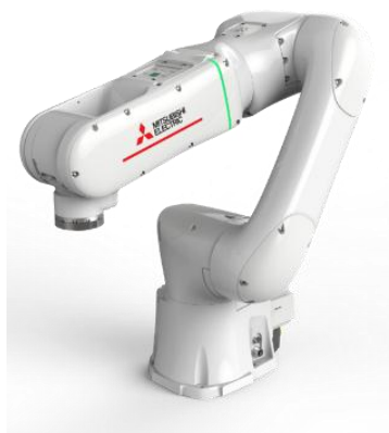
Robot collaboratif série MELFA ASSISTA

TOKYO, 20 mai 2020 – Mitsubishi Electric Corporation (TOKYO : 6503) a annoncé aujourd'hui qu'elle lancera le 21 mai sa série de robots MELFA ASSISTA qui travaillent en collaboration avec les humains sur la base de fonctions de sécurité, telles que la détection des collisions, et dans le strict respect des normes internationales de sécurité et de robotique ISO 10218-1 et ISO/TS15066. La série intégrera également un logiciel d'ingénierie intuitif, RT VisualBox, pour un déploiement rapide et facile du système. Les clients utiliseront MELFA ASSISTA et RT VisualBox pour une production plus efficace, pour réduire le coût total de possession (TCO) des systèmes de fabrication robotisés et pour répondre aux nouveaux besoins en matière de distanciation adéquate des travailleurs sur les sites de fabrication.