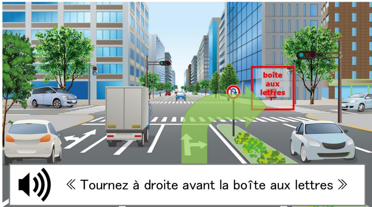
Exemple d'indications contextuelles proposées par Scene-Aware Interaction

sanitaire, ou encore de la prise en charge d'opérations sans contact sur des machines dans des lieux publics, entre autres.