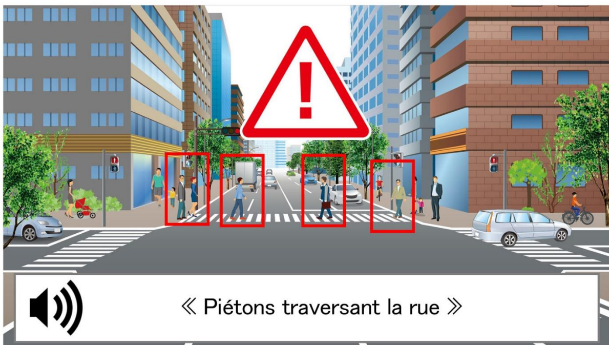
Exemple d'indications destinées à éviter les risques proposées par Scene-Aware Interaction