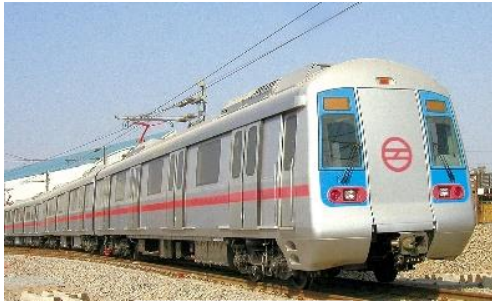
Le métro de Delhi