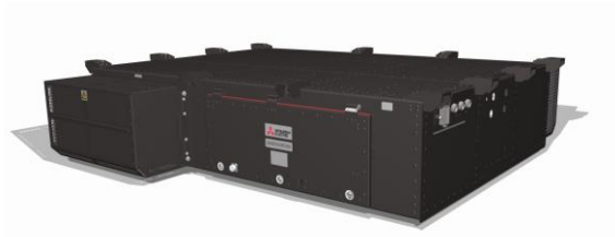
Équipement électrique fourni pour le métro de Delhi (convertisseur de traction)